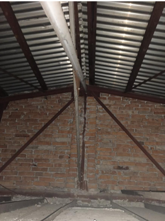
OCELOVÝ PŘÍHRADOVÝ VAZNIK VČETNĚ ZTUŽENÍ