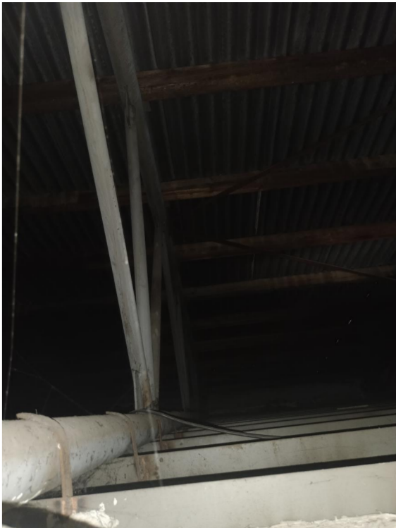
KOTVENÍ ATYPICKÝCH "STROPNÍCH NOSNÍKŮ" NA SPODNÍ PÁSNICI OCELOVÉHO VAZNIKU