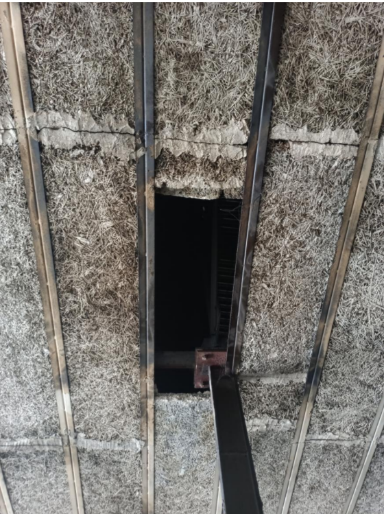
STŘEDOVÝ OCELOVÝ SLOUP PODPÍRAJÍCÍ OCELOVÝ PŘÍHRADOVÝ VAZNIK