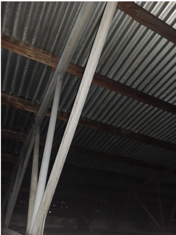
OSAZENÍ DŘEVĚNÝCH VAZNIC NA HORNÍ PÁSNICI OCELOVÉHO VAZNIKU POMOCÍ L ÚHELNÍKŮ

! VEŠKERÁ PRÁVA VYHRAZENA, TATO DOKUMENTACE JE AUTORSKÝM DILEM A MUŽE BYT UŽITA VÝHRADNĚ K ÚČELU NA NÍ UVEDENÉMU A SMLUVNĚ DOHODNUTÉMU MEZI AUTOREM A OBJEDNATELEM